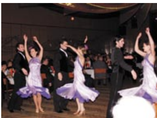
V bohatom kultúrnom programe dominovali ako po iné roky spoločenské tance.