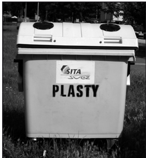
Dvojstranu spracoval Jozef Mečiar

V ďaka spoločnosti SITA Suez, ktorá zabezpečuje odvoz komunálneho odpadu, bol v meste spustený experiment v separovaní PET fliaš. V časti mesta bolo rozmiestnených niekoľko kontajnerov (pozri obrázok) na zber tohto druhu odpadu. Do týchto kontajnerov je možné dávať PET fľaše aj s uzávermi ako aj iné plastové predmety. Experiment bude prebiehať do konca tohto roku a je predpoklad, že sa tento spôsob separácie rozšíri do celého mesta.